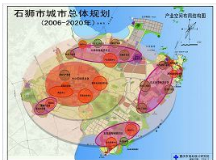
（石狮市城市总体规划图 2006-2020 年）