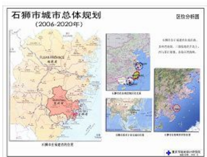
（石狮区位分析图 2006-2020 年）

石狮服装城位于海峡西岸经济区腹地“中国休闲服装名城”石狮市是福建省重点商贸建设项目，以石狮为中心，连接晋江、泉州等周边地区而形成的福建“闽派”服装板块。从建筑布局上讲，石狮服装城是国内屈指可数的大型服装专业市场；从功能规划上讲，石狮服装城除服装交易区外，还包括展览艺术中心，星光休闲广场，商务配套区，现代物流配送中心，客运站等完善的配套功能。