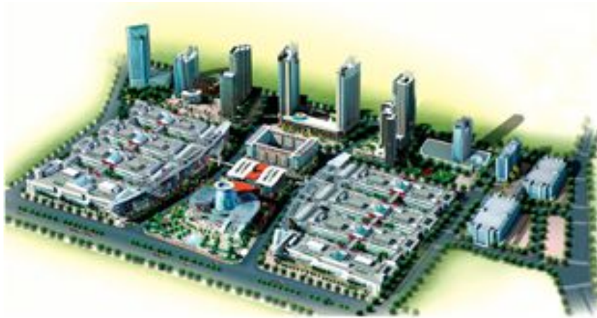
(石狮服装城鸟瞰图)